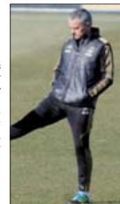
«Nous ne serons pas champions avant d'affronter le FC Barcelone»

- Voilà le parfait exemple de ces tartineux de tifs au gel !