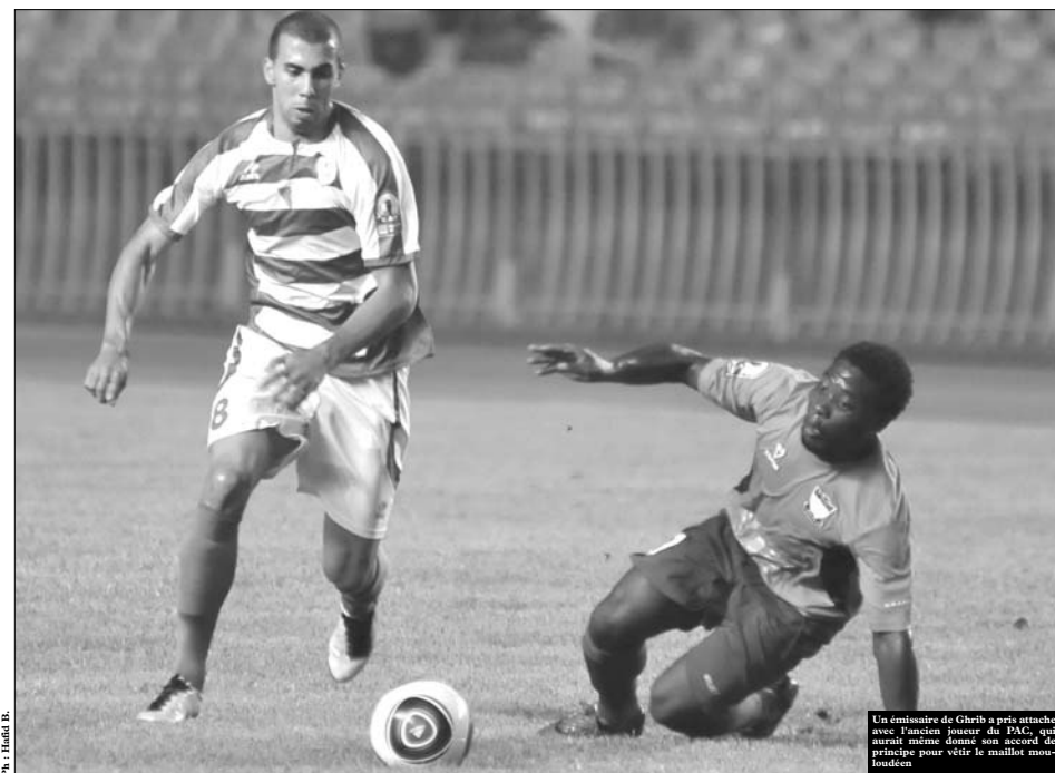
Un émissaire de Ghrif à pris attache avec l'ancien joueur du PAC, qui aurait même donné son accord de principe pour vêtir le maillot mouloudéen.

A l'issue de la 20 e journée du championnat de Ligue 1 algérienne de football, le MCA a perdu encore une nouvelle place au classement, puisque la victoire acquise par le CSC au stade d'El Harrach, a permis au club constantinois de prendre la 9 e place.