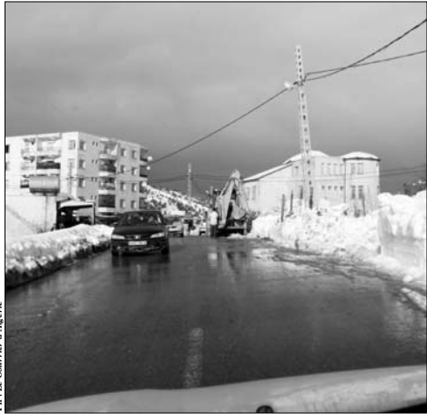
PH. D. DR

Cette institution éducative est fermée depuis les premières chutes de neige nous dira notre interlocuteur. En effet, l'école offre une image d'abandon à cause des gigantesques amas de neige visibles à travers le portail d'entrée à demi ouvert. « C'est depuis le premier jour des intempéries que les enfants ont déserté leurs classes et n'ont pu venir à cause du froid et de la neige. Préciser