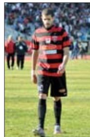
«La touche d'Ighil commence à venir»

- Pas vrai ! Il t'arrive de dire sensé, le Mou ?