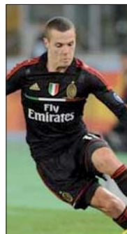
«Le professionnel que je suis a commencé par être marchand de légumes»

- Le quadruplé quoi ? Ah, pardon, c'est vrai qu'il s'agit d'extra terrestre