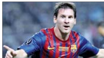
«Le quadruplé stellaire de Messi»

Mundo Deportivo, journal sportif espagnol