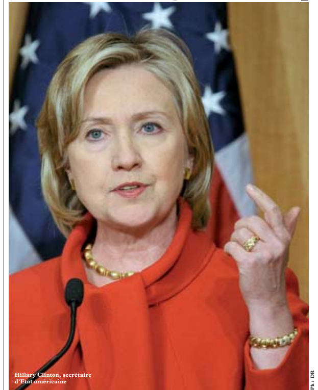
Hillary Clinton, secrétaire d'Etat américaine