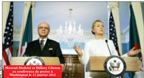
Mourad Mededji et Hillary Clinton en conférence de presse à Washington le 12 janvier 2012

politique, en raison, aussi, de la proximité des élections législatives. Mais de fait, la visite de la secrétaire d'État américaine, la première en Algérie, depuis celle de Condoleezza Rice, en septembre 2008, est un appel déclaré au processus de réformes lancé par le président Bouteflika et à la tenue de législatives qui se veulent claires et transparentes. Dans une intervention remarquée, début novembre, Mme Clinton a affirmé que l'arrivée d'islamistes « modérés » aux affaires dans plusieurs pays arabes ne gênait pas la politique des États-Unis, dans la mesure où ils se montrent respectueux des droits de l'homme et des règles élémentaires de la démocratie et de l'alternance politique. Comme les autres pays occidentaux, les États-Unis ont vu avec inquiétude les partis islamistes remporter les premières élections post-« Printemps arabe » en Égypte et en Tunisie. Pas plus que les autres, ils ne sont optimistes sur leur propre capacité à peser sur le processus politique. Pragmatiques, ils ont décidé de faire avec, et de prendre le train en marche et de prendre langue avec des islamistes, auxquels ils attribuent de « modérés ». Alors que les États-Unis étaient perçus, jusqu'alors, comme les champions du statu quo et du soutien aux autoritaires, ils sont désormais obligés de repenser leur relation avec les pays arabes. L'ambassadeur des États-Unis en Algérie, Henri S. Ensher, qui ne se gêne pas pour interférer dans la politique