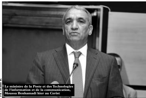
Le ministre de la Poste et des Technologies de l'information et de la communication, Moussa Benhamadi hier au Cerist.

Le ministre de la Poste et des Technologies de l'information et de la communication, Moussa Benhamadi, a lancé hier la Commission nationale de large bande (Haut et très haut débit). Il a déclaré que cette nouvelle fonctionnalité est un grand défi à relever.